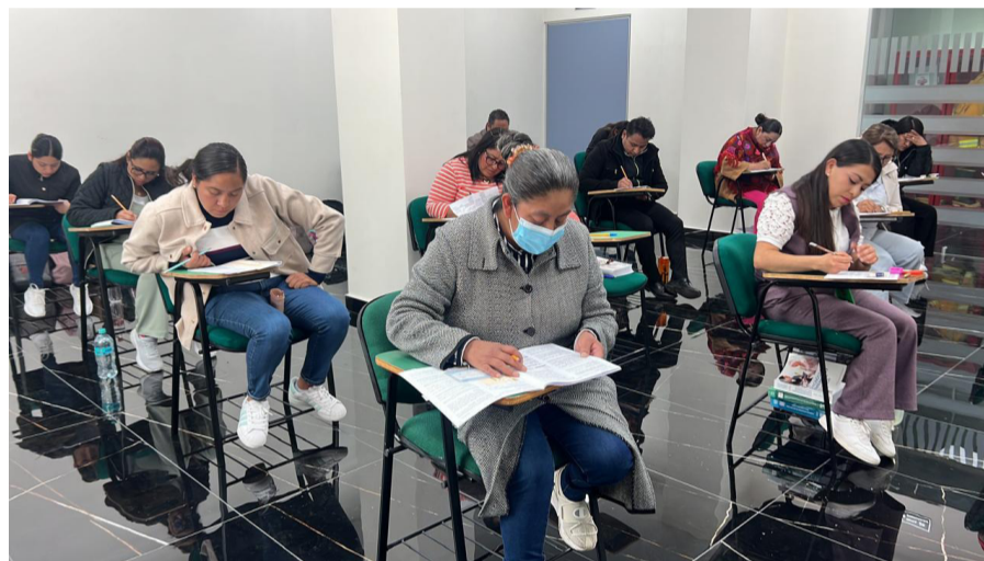
Promoción de certificación y recertificación, en las instalaciones del SUTEYM-ISSEMYM

Durante este proceso se llevó a cabo una promoción de certificación y recertificación donde participaron un total de 23 aspirantes: 5 aspirantes para proceso de recertificación como licenciadas en enfermería, 4 aspirantes para certificación como licenciadas en enfermería y 14 aspirantes para proceso de certificación como docentes en el mes de abril del año 2025, el cual fue llevado a cabo en una sola sede en la Ciudad de Toluca en las instalaciones del SUTEYM-ISSEMYM, en un horario de 7:00 a. m. – 18:00 p.m., con una asistencia del 100% de las participantes.