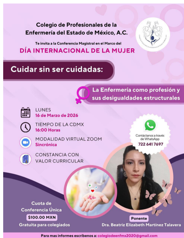
16 de marzo conferencia: Cuidar sin ser cuidadas: La enfermería como profesión y sus desigualdades estructurales .

el contexto laboral presenta similitudes, se habló de la segregación vertical, la brecha salarial, la precarización institucional.