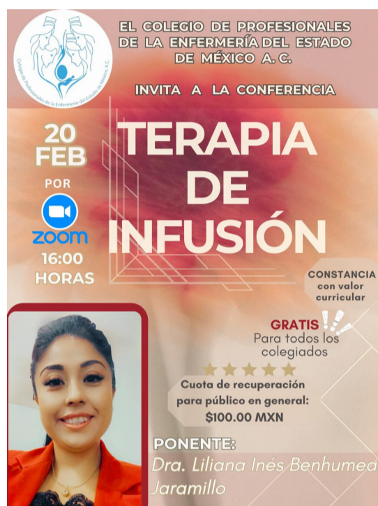
20 de febrero conferencia: Terapia de infusión .